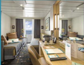
2-Bett-Superior, Balkon, Orion-/Apollo-/Jupiter-Deck (Kat. PG, P, Q, R, Q1)