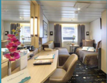
2-Bett außen, Neptun-/Saturn-/Orion-/Apollo-Deck (Kat. I, J, K, M, O, J1, L)