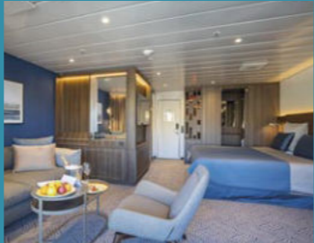
2-Bett-Suite, Balkon, Lido-Deck (Kat. V)