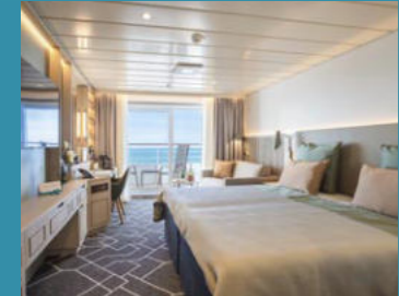
2-Bett-Junior-Suite, Balkon, Jupiter-/Lido-Deck (Kat. S, T)