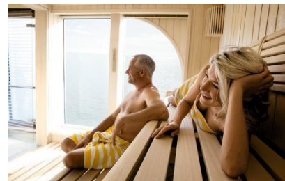
Deck 4 (Sonnendeck)